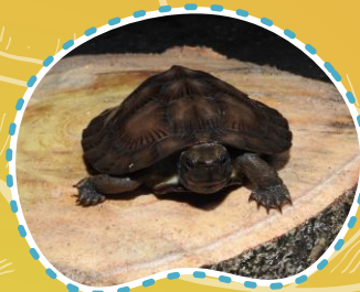
Kura-kura daun Lokkipad Cyclernys dentata