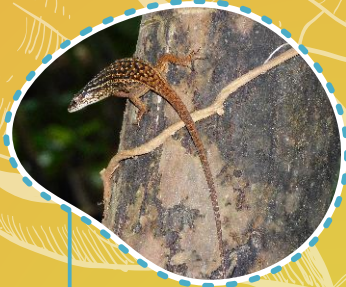
Kadal serasah Eutropis rugifera