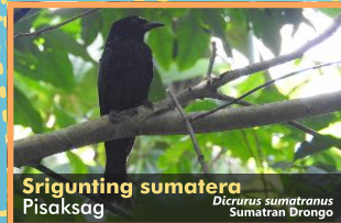
Srigunting sumatera Pisaksag Dicrurus sumatranus Sumatran Drongo