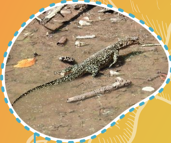
Biawak Varanus salvator