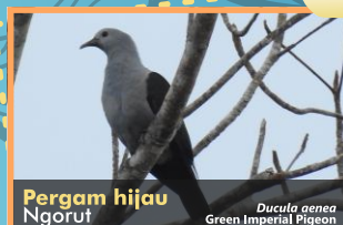
Pergam hijau Ngorot Ducula aenea Green Imperial Pigeon