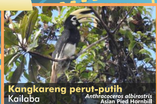
Kangkareng perut-putih Kailaba Anthraceres albinotris Asian Pied Hornbill