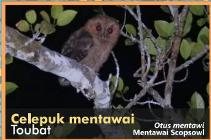
Celepuk mentawai Toubat Otus mentawai Mentawai Scopsowl