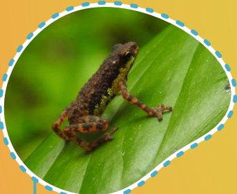
Patib putaratat Pelophryne brevipes