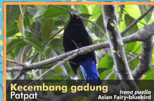
Kecembang gadung Patpat Irena puella Asian Fairy-bluebird