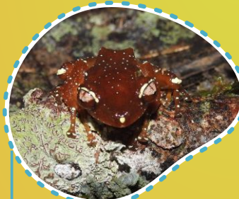
Katak pohon berbintik putih Teilet pageta sabbau Nyctixalus pictus