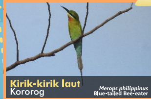
Kirik-kirik laut Kororog Merops philippinus Blue-tailed Bee-eater