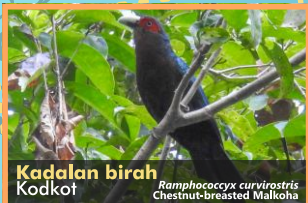
Kadalan birah Kodkot Ramphococcyx curvirostris Chestnut-breasted Malkoha