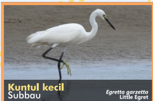
Kuntul kecil Subbau Egretta garzetta Little Egret