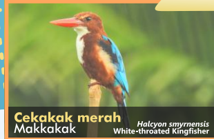
Cekakak merah Makkakak Halcyon smyrnensis White-throated Kingfisher