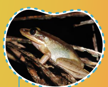
Kongkang siberut Taratata sikakatkat Hylarana parvacola

Ada lebih dari 80 jenis amfibi dan reptil hidup di Kepulauan Mentawai. Dari jenis-jenis tersebut, banyak di antaranya yang aktif dan hanya dijumpai pada malam hari, seperti ular dan katak. Keberadaan mereka membantu menyeimbangkan ekosistem dan harus dijaga agar tidak punah.