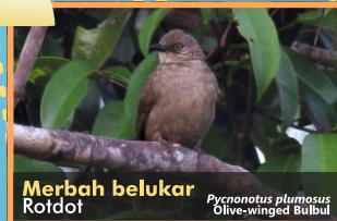
Merbah belukar Rotdot Pycnonotus plumosus Olive-winged Bulbul