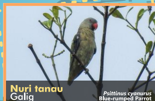
Nuri tanau Galig Psittinus cyanurus Blue-rumped Parrot