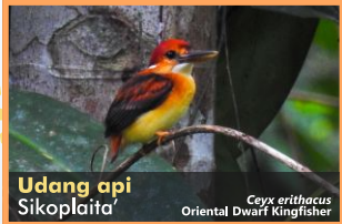
Udang api Sikoplaita Ceyx erithacus Oriental Dwarf Kingfisher