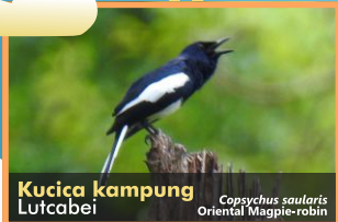
Kucica kampung Lutcabei Copsychus saularis Oriental Magpie-robin