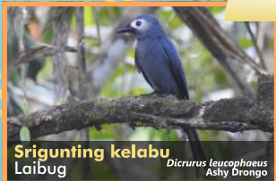
Srigunting kelabu Laibug Dicrurus leucophaeus Ashy Drongo