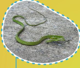
Ular pucuk Ulou manua Ahaetulla prasina