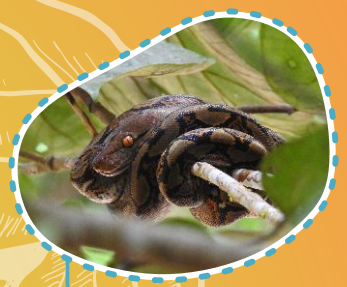
Sanca kembang Saba Phyton reticulatus