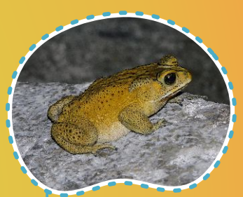
Kodok puru rumah Teilet padang Duttaphrinus melanostictus