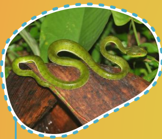
Bandotan palem asia Ulou bopaipai Trimeresurus popeorum