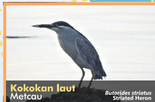
Kokokan laut Metcau Butorides striatus Striated Heron