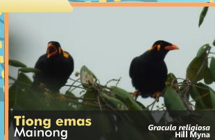
Tiong emas Mainong Gracula religiosa Hill Myna