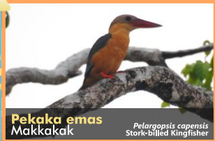
Pekaka emas Makkakak Pelargopsis capensis Stork-billed Kingfisher