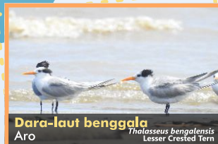
Dara-laut benggala Aro Thalasseus bengalensis Lesser Crested Tern