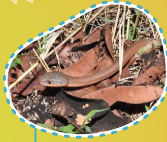
Ular boiga merah Sipakpak Boiga nigriceps