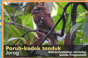
Paruh-kodok tanduk Jorog Batrachostomus cornutus Sunda Frogmouth