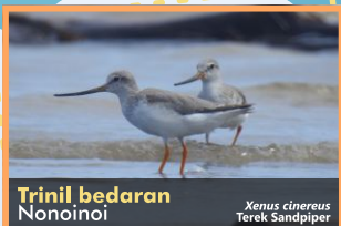
Trinil bedaran Nonoinoi Xenus cinereus Terek Sandpiper