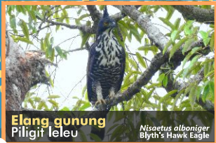
Elang gunung Piligit leleu Nisaetus alboniger Blyth's Hawk Eagle

Alam Kepulauan Mentawai menyuguhkan keindahan beragam jenis burung. Setidaknya 178 jenis burung telah tercatat di Bumi Sikerei ini, yang dapat dijumpai di pesisir, pekarangan, kebun maupun hutan. Dari ratusan jenis itu, celepuk mentawai menjadi satu jenis endemik yang tidak ditemukan di manapun di dunia selain di Kepulauan Mentawai. Kekayaan ini merupakan anugerah yang harus terus dijaga dan dilestarikan.