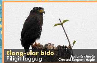
Elang-ular bido Piligit laggug Spilornis cheela Crested Serpent-eagle