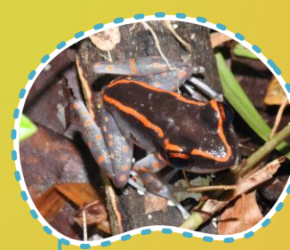
Kongkang siberut Lolok akak Pulchrana siberu