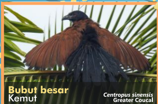
Bubut besar Kemut Centropus sinensis Greater Coucal